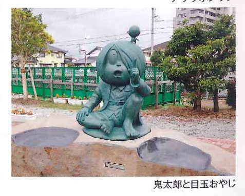
新たに駅前公園に 設置された 鬼太郎たち