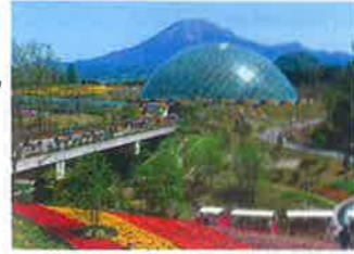
とっとり花回廊と大山