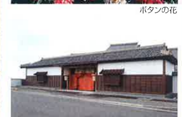
由志園平成の人参方