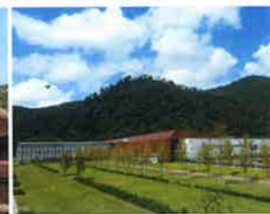
古代出雲歴史博物館